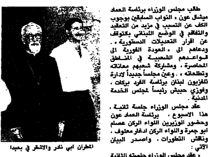
الفران ابي نادر والفران في بعيدا

طلب مجلس الوزراء برئاسة العماد ميشال عون، والنواب السبعين بوجود الكف عن التصويب في مزيد من التعديلات والتفكير في الوضع اللبناني، عن اقرار التعديلات الدستورية، وبعدهم الى العودة الفورية الى قواعدهم الدستورية في المناقشة، ومشاركة شعبيهم معانته وتطلعاته، وعن مجلسا جديدا لادارة تلفزيون لبنان برئاسة الفر بركات، وفوزي رئيساً لمجلس الخدمة المدنية.